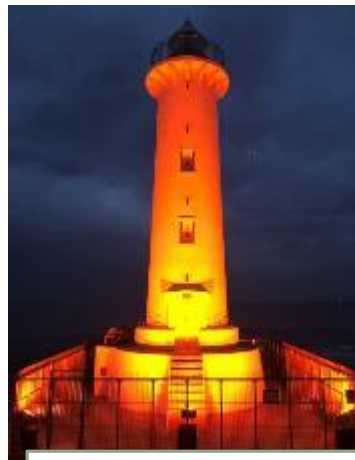
野間灯台 (愛知県美浜町)