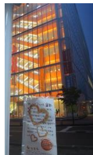
複合施設アオッサ (福井県福井市)