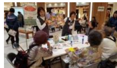
商業施設での啓発イベント(京都市)