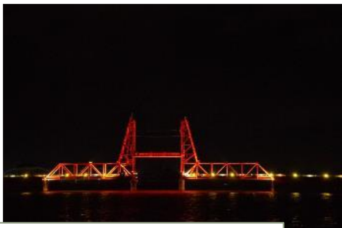
筑後川昇開橋遊歩道(福岡県大川市)