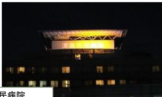
津島市民病院 (愛知県)