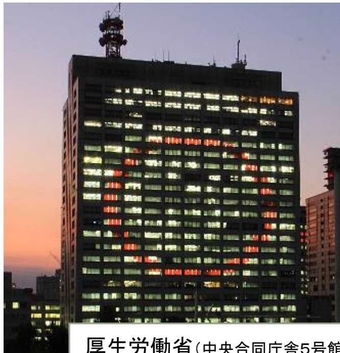
厚生労働省(中央合同庁舎5号館)