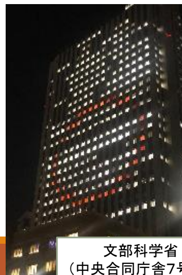
文部科学省 (中央合同庁舎7号館)