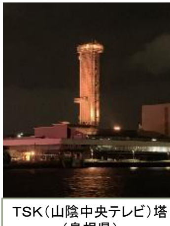
TSK(山陰中央テレビ)塔 (島根県)