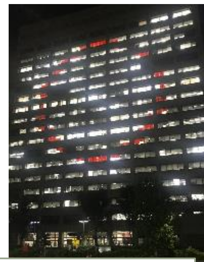
経済産業省 (中央合同庁舎7号館)