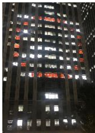
金融庁 (中央合同庁舎7号館)