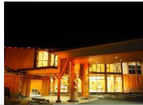
朝日村役場 (長野県)