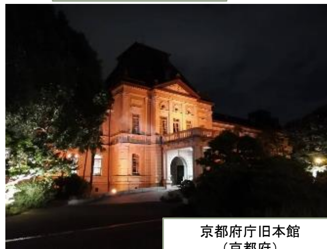
京都府庁旧本館 (京都府)