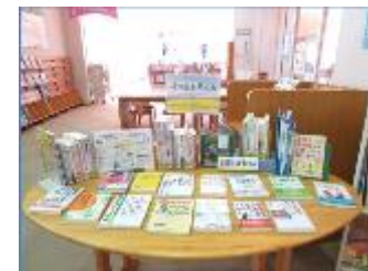
図書コーナーの設置(神奈川県二宮町)