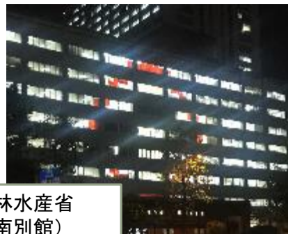
農林水産省 (南別館)