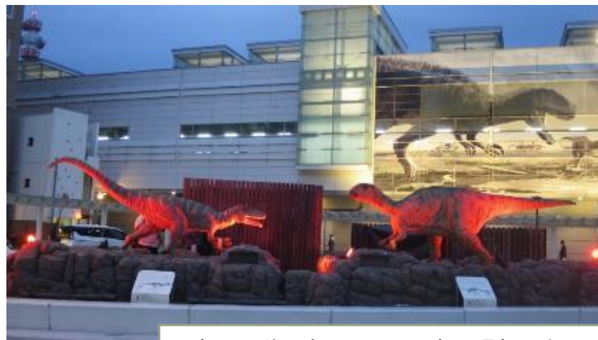
福井駅前恐竜モニュメント(福井県福井市)