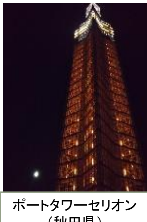
ポートタワーセリオン (秋田県)