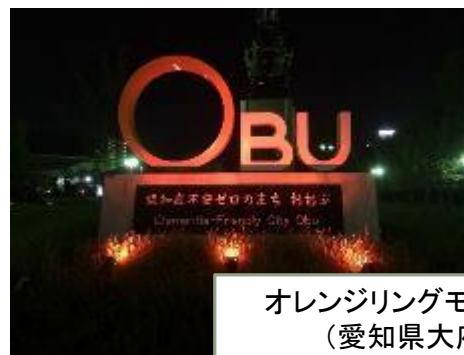
オレンジリングモニュメント (愛知県大府市)