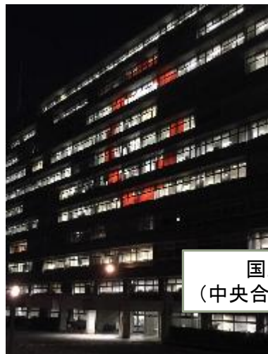
国土交通省 (中央合同庁舎3号館)