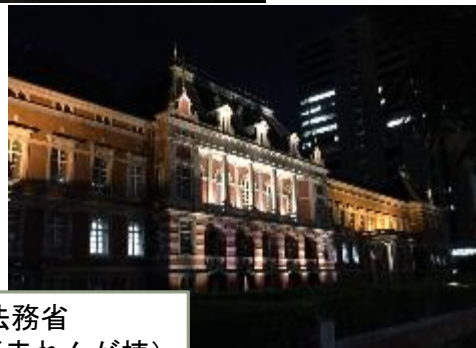
法務省 (旧本館(赤れんが棟))