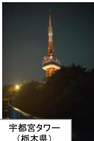
宇都宮タワー (栃木県)

9月21日を中心に、各地のランドマークや庁舎等がオレンジ色にライトアップされました。