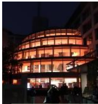
大府市役所 (愛知県)