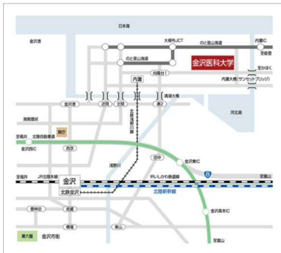
※クリックすると拡大します