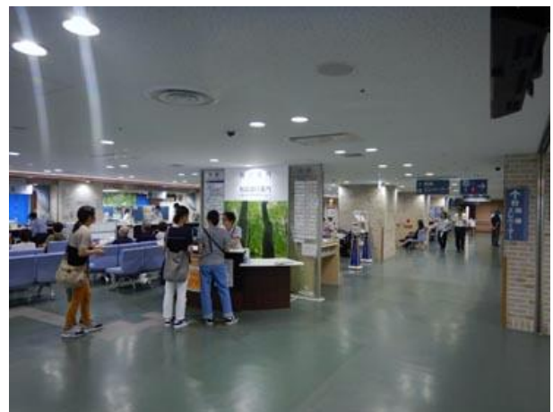
②正面玄関をに入って、まっすぐ進む