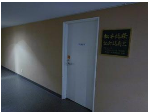
⑤左手に会場入り口