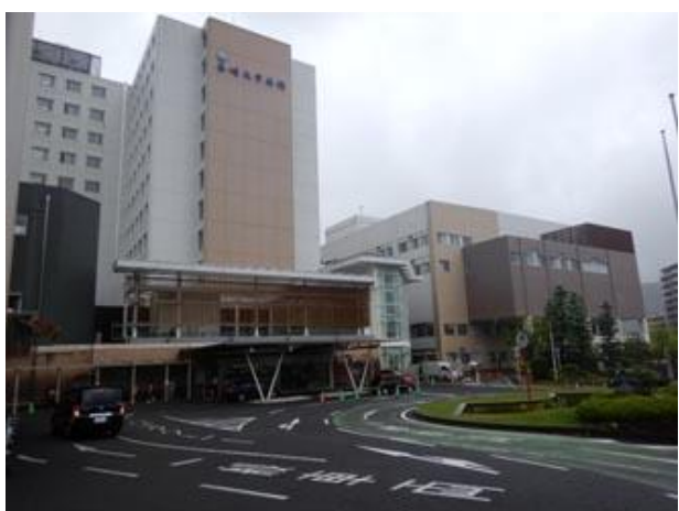
①大学病院正面の右側へ進む