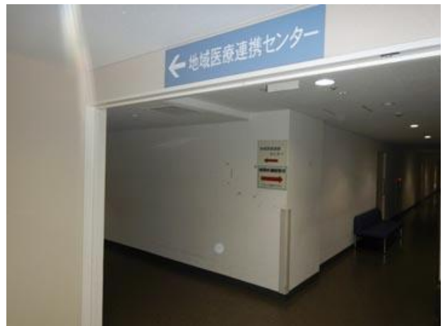
④一つ目の角を左へ進む