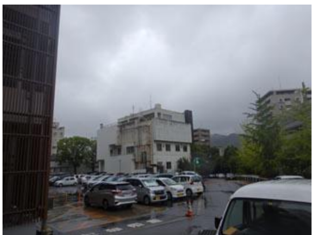
③建物を通り過ぎて