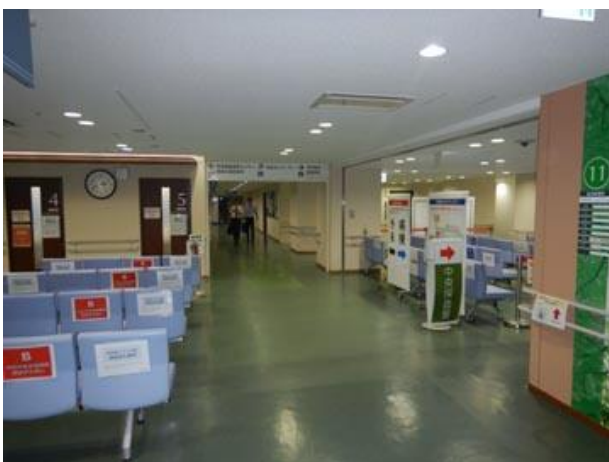
③突き当りを左へ進む