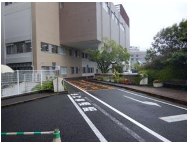
②建物手前を通り奥に進む