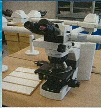
計測に用いる顕微鏡