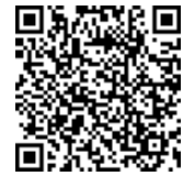
〈アクセスマップ〉 スマートフォン・携帯から