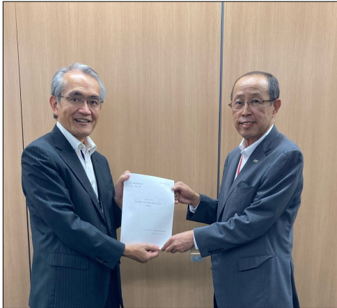
写真左：伊原和人保険局長 写真右：宮島会長

なお、要望書全文については、当会ホームページの「資料・ガイドライン」をご参照ください。