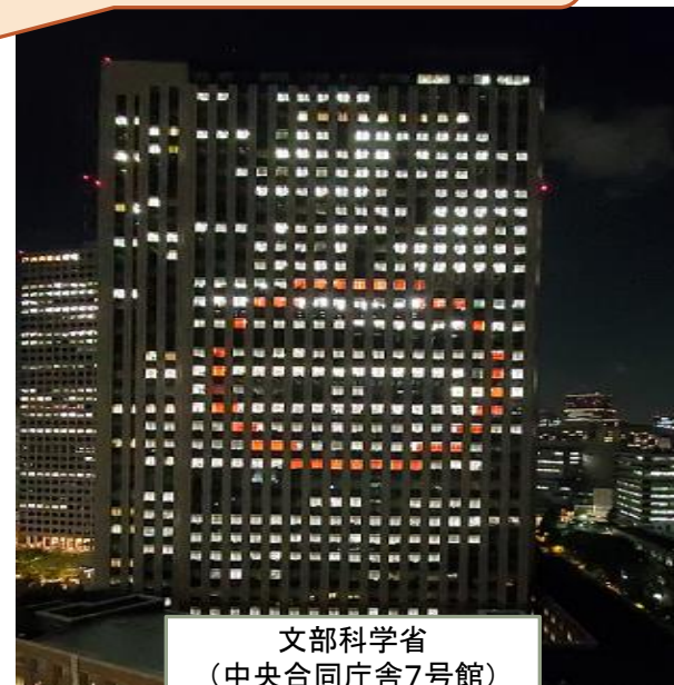
文部科学省 (中央合同庁舎7号館)