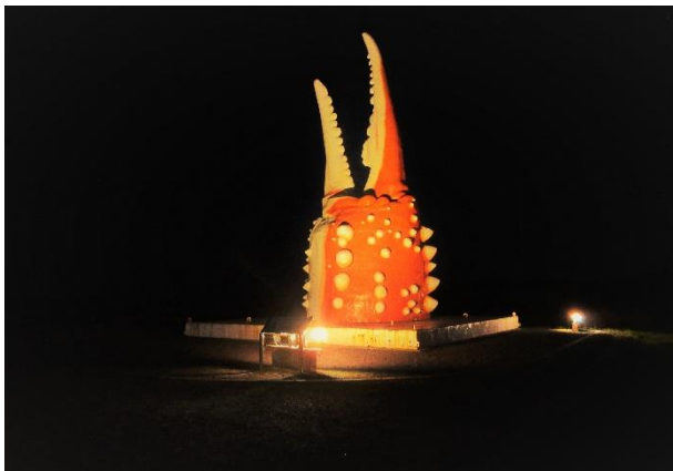
カニの爪 (北海道紋別市)