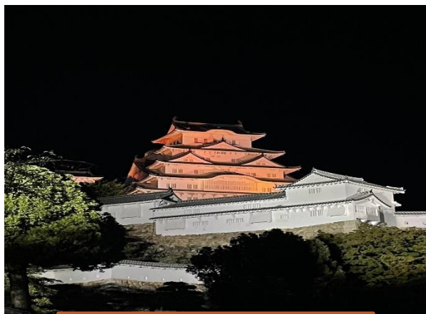
姫路城 (兵庫県姫路市)