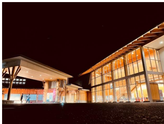
朝日村 (長野県朝日村)