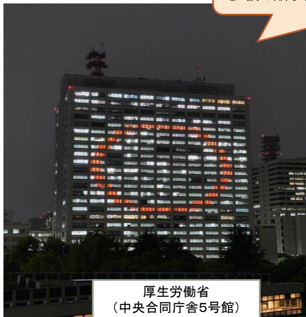
厚生労働省 (中央合同庁舎5号館)