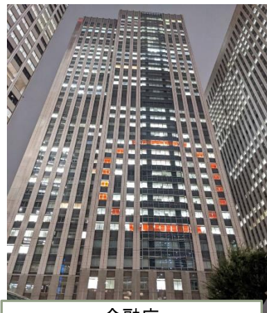
金融庁 (中央合同庁舎7号館)