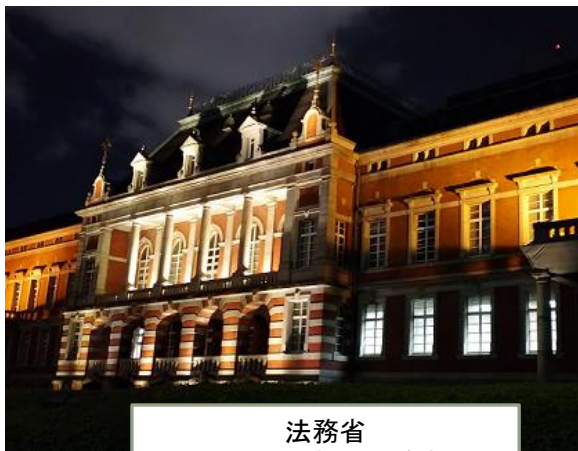
法務省 (旧本館(赤れんが棟)) ※ライトアップを実施