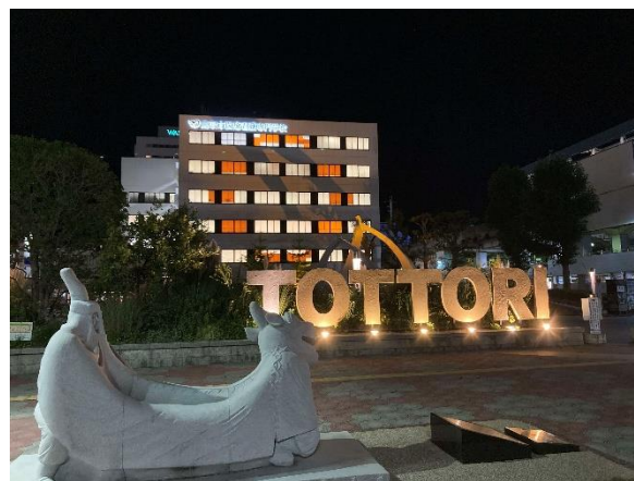
鳥取市医療看護学校 (鳥取県鳥取市)