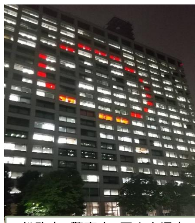
総務省、警察庁、国土交通省 (中央合同庁舎2号館)