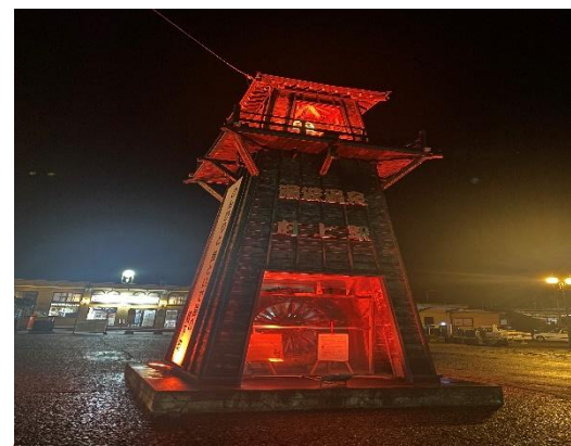
村上駅 (新潟県村上市)