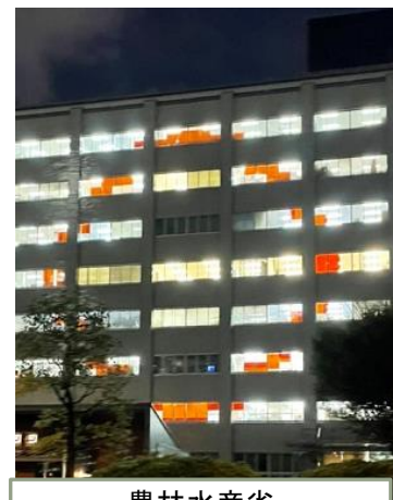
農林水産省 (南別館)